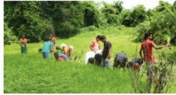
दालमिया महाविद्यालयातील विद्यार्थी नरपड गावात भातसिंवासत काम करताना.